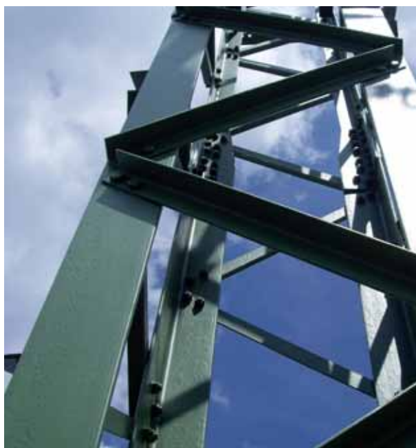
rozvodna Kočín →