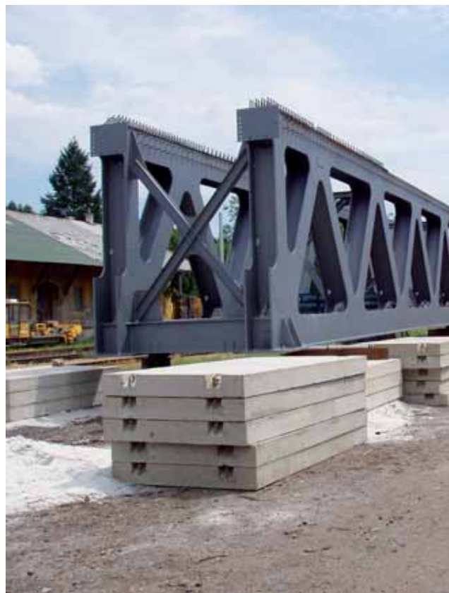
železniční most Klášterec nad Ohří ← autobusové nádraží Praha-Letňany