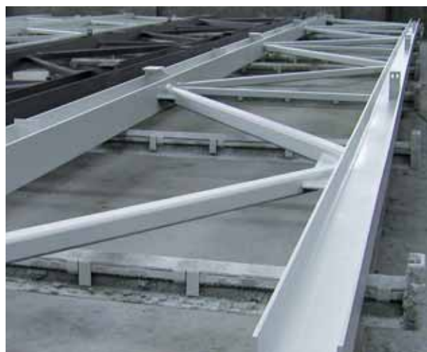
oc. konstrukce hal, automobilka TPCA Czech, Kolín