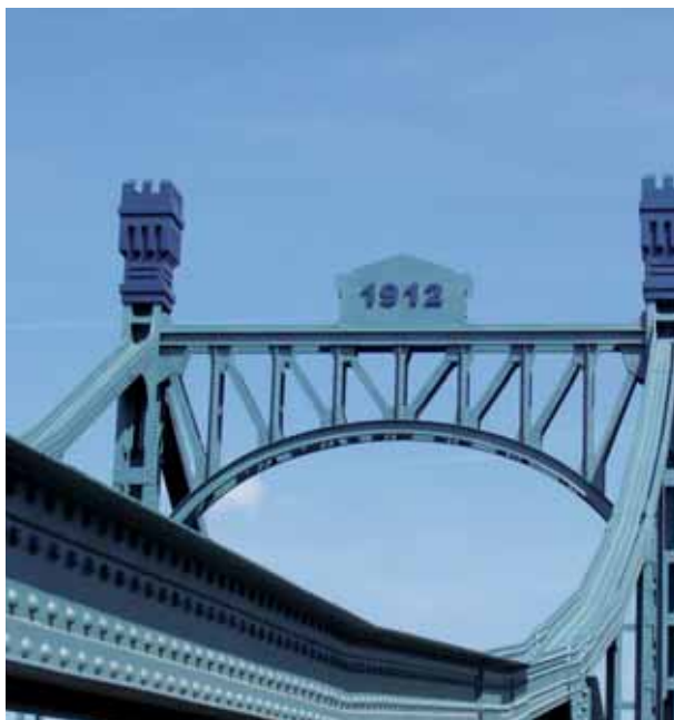
silniční most Štěpán, přemostující řeku Labe u Neratovic silniční most Nymburk →

2) Sika® Permacor® 2230 VHS alternativní materiál SikaCor® EG 4 nebo Sika® Permacor® 2330